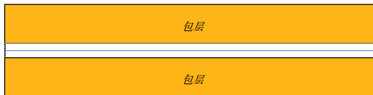
图 2b - 单模光纤